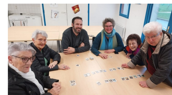
Jeux à la ludothèque de Gosné