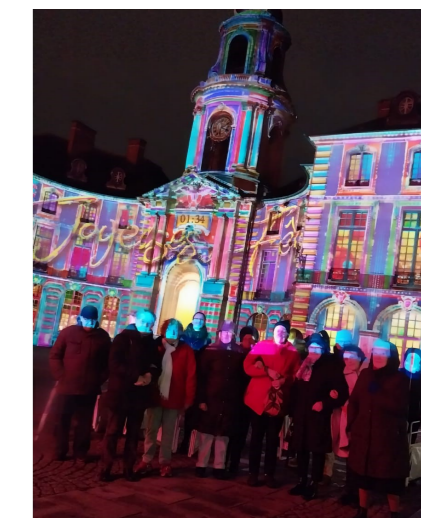
Illuminations de Noël à Rennes