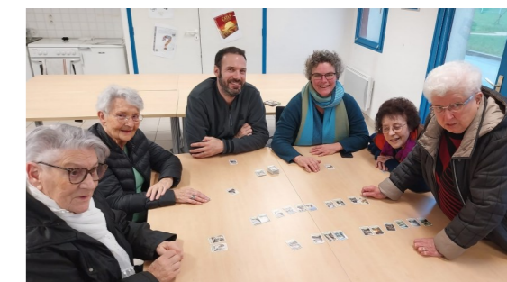
Jeux à la ludothèque de Gosné