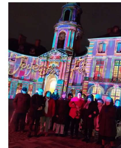
Illuminations de Noël à Rennes